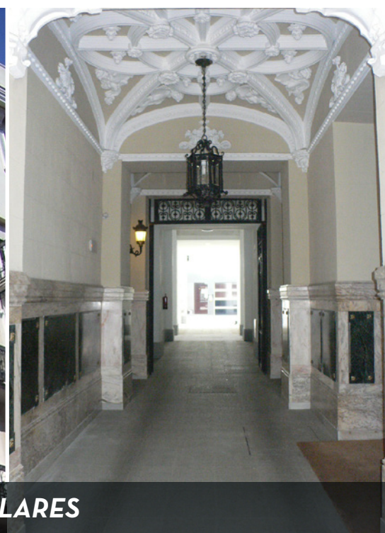
REHABILITACIÓN DE EDIFICIOS SINGULARES